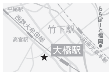
純真学園大学 筑紫丘キャンパス (福岡市南区筑紫丘1-1-1)