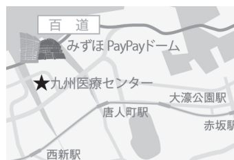
純真学園大学 百道浜キャンパス (福岡市中央区地行浜1-8-1)